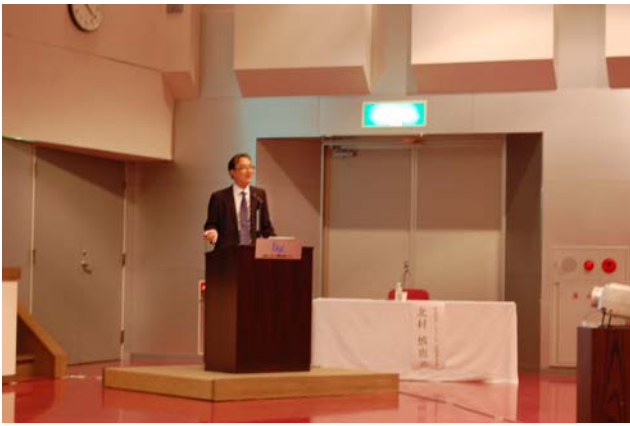
経営基盤・技術向上等セミナー (9/2)