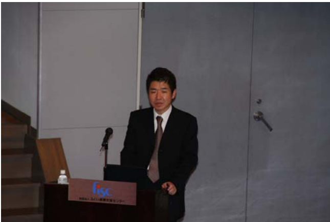
福井デザインアカデミー (9/2)