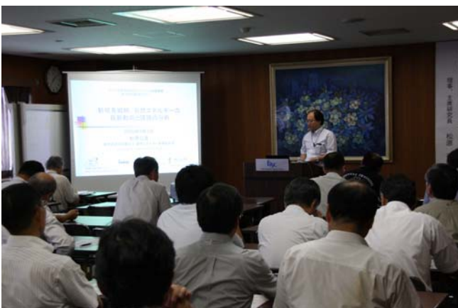
未来技術創造セミナー (9/3)