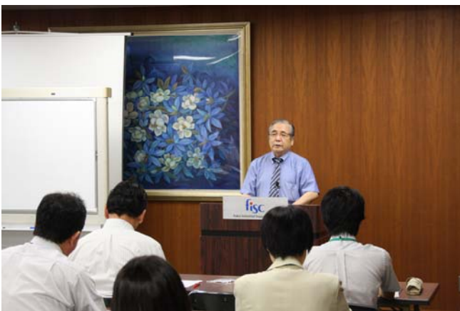
マーケティングセミナー (9/3)