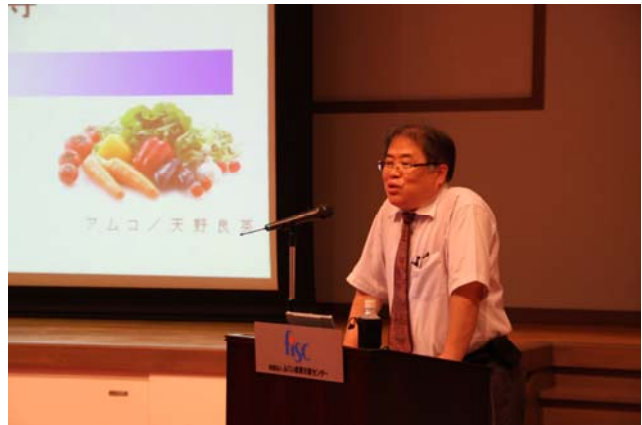
地域資源・農商工連携セミナー (9/3)