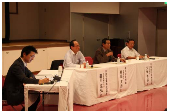
人材育成公開講座 (9/3)