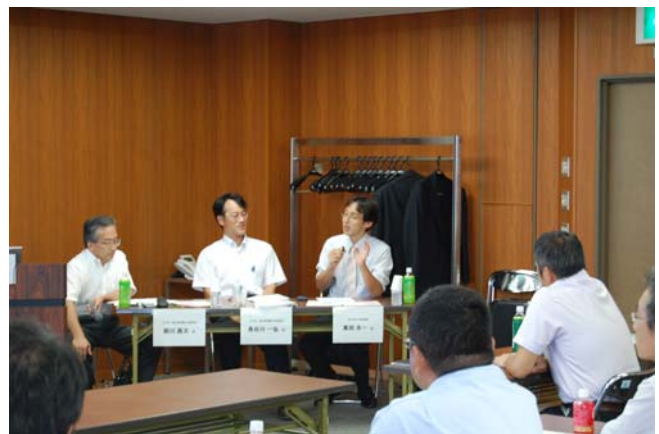
I T 経営推進セミナー (9/2)