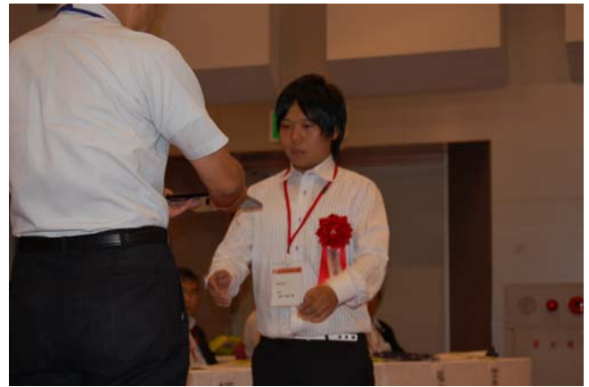
新事業フロンティア大賞表彰式