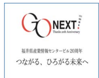
20周年記念ロゴマーク

※福井県産業情報センターは福井県が設置し、指定管理の指定を受けた当センターが管理運営を行っており、今年、運用開始から20周年を迎えました。