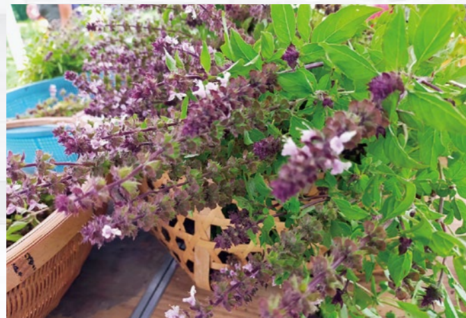
薄紫色の花を咲かせるホーリーバジルは、暑さに強いシソ科の植物。

や、2024年の北陸新幹線福井・敦賀延伸を控え、全国から注目が集まる池田町。そんな中、同社は水海地区に加え、新しく同町角間地区での栽培を拡大。将来は5万本のホーリーバジルを楽しめる観光農園を開園することを目標の1つにかかげ、「まずは池田町で毎年開催されている秋の収穫祭などのイベントや、地域の活動に積極的に参加することで、今まで以上に県内外のお客様へ池田町やホーリーバジルの素晴らしさをお伝えできれば」と、熱く抱負を語ります。