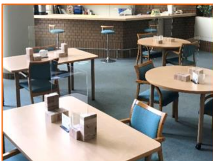
コミュニティホール