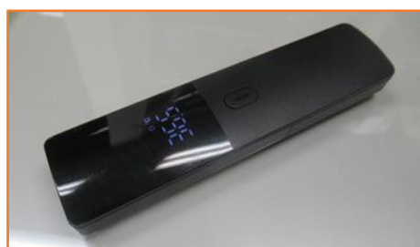
非接触型体温測定器