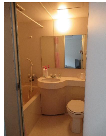
宿泊室Bユニットバス