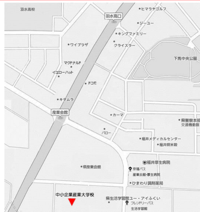
中小企業産業大学校 (福井市下六条町 16-15)