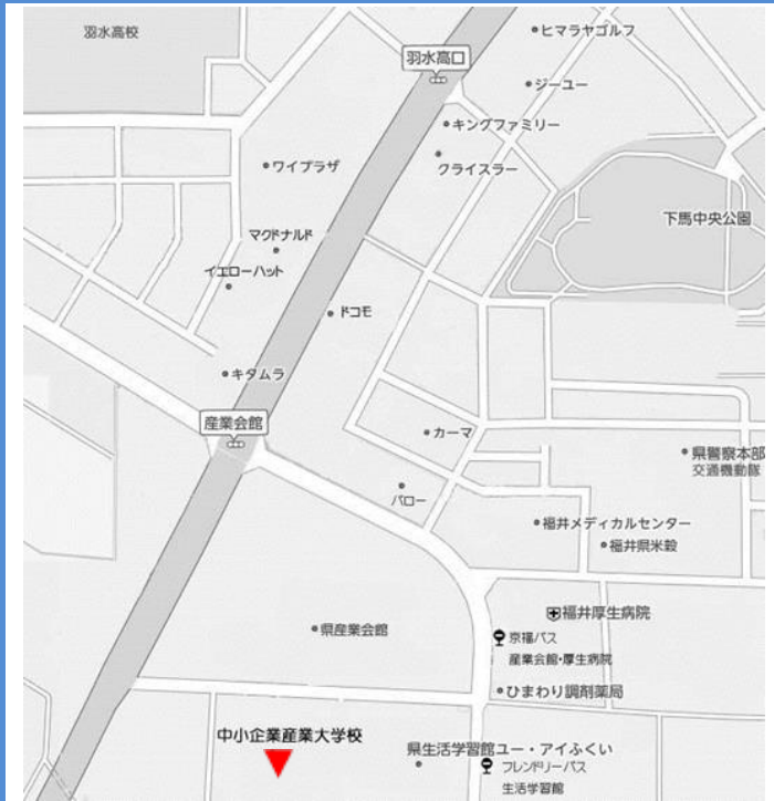
中小企業産業大学校 (福井市下六条町 16-15)