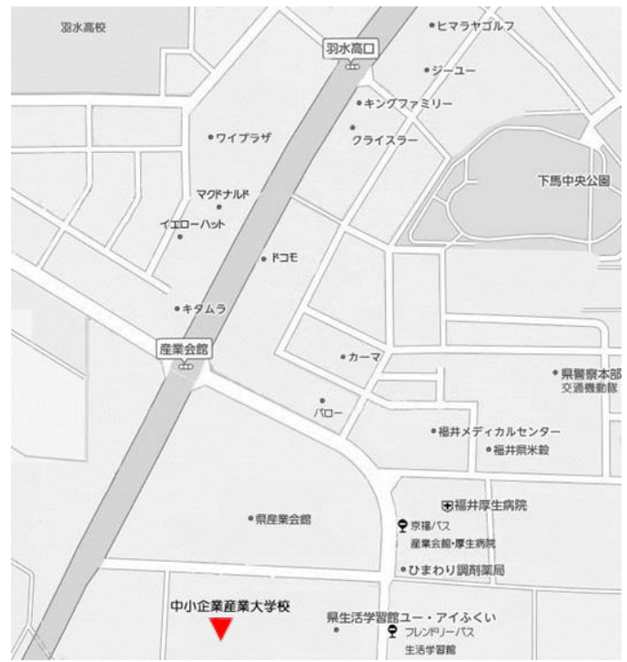
中小企業産業大学校 (福井市下六条町 16-15)