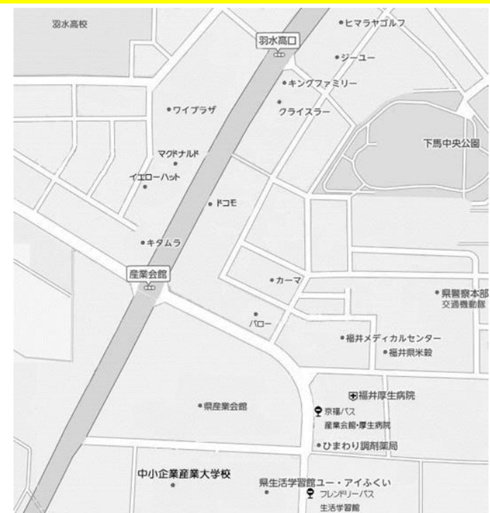
中小企業産業大学校 (福井市下六条町 16-15)