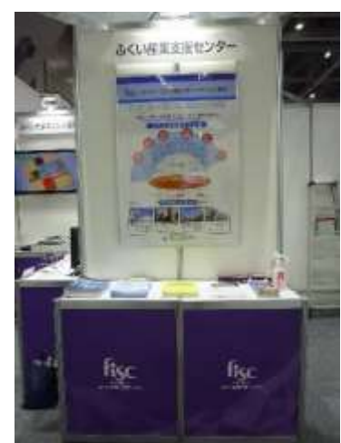
(公財) ふくい産業支援センター