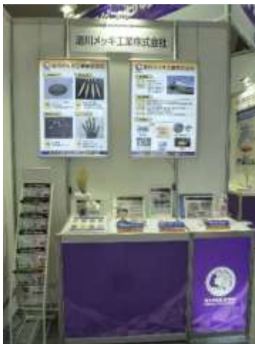
清川メッキ工業(株)