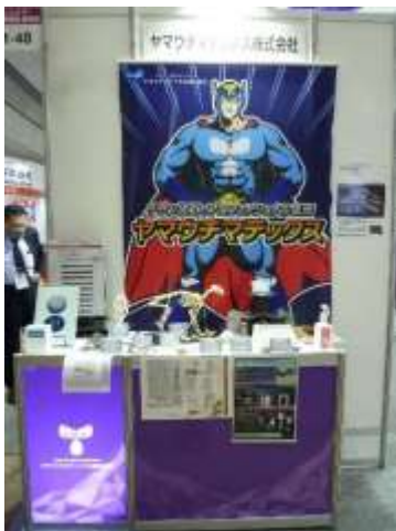
ヤマウチマテックス(株)