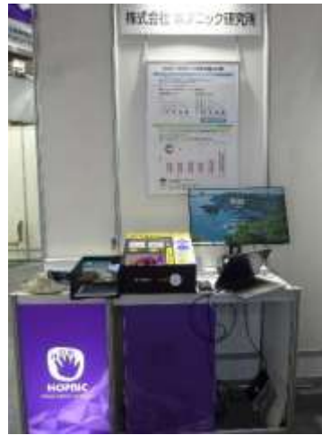
(株)ホブニック研究所