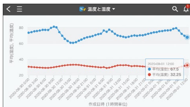
MESHによる温度湿度データ取得