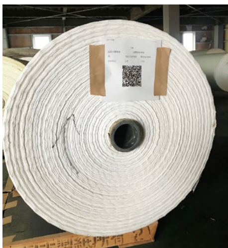
QRコードによる在庫管理

《導入機器》 kintone (サイボウズ株製) MESH温度湿度センサー (SONY株製)